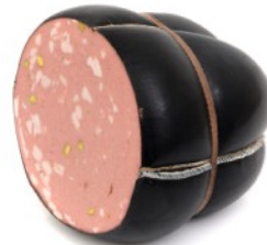
IMMAGINE PRODOTTO (da catalogo a titolo esemplificativo) Product image as example

Non forare la confezione. Aprire la confezione 10 minuti prima di affettare. Do not pierce the package. Open the pack 10 minutes before slicing.